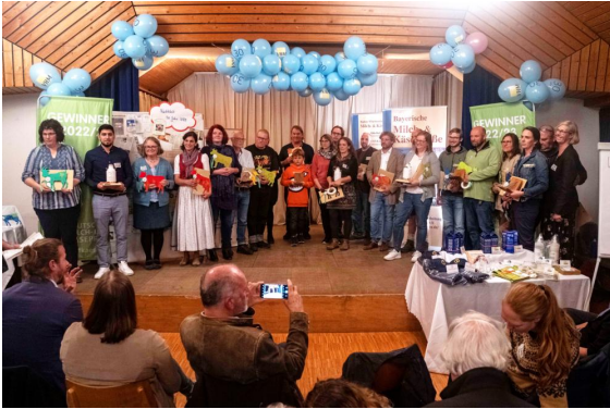
Preisverleihung auf dem Dottenfelderhof am 15.10.2022 in Bad Vilbel